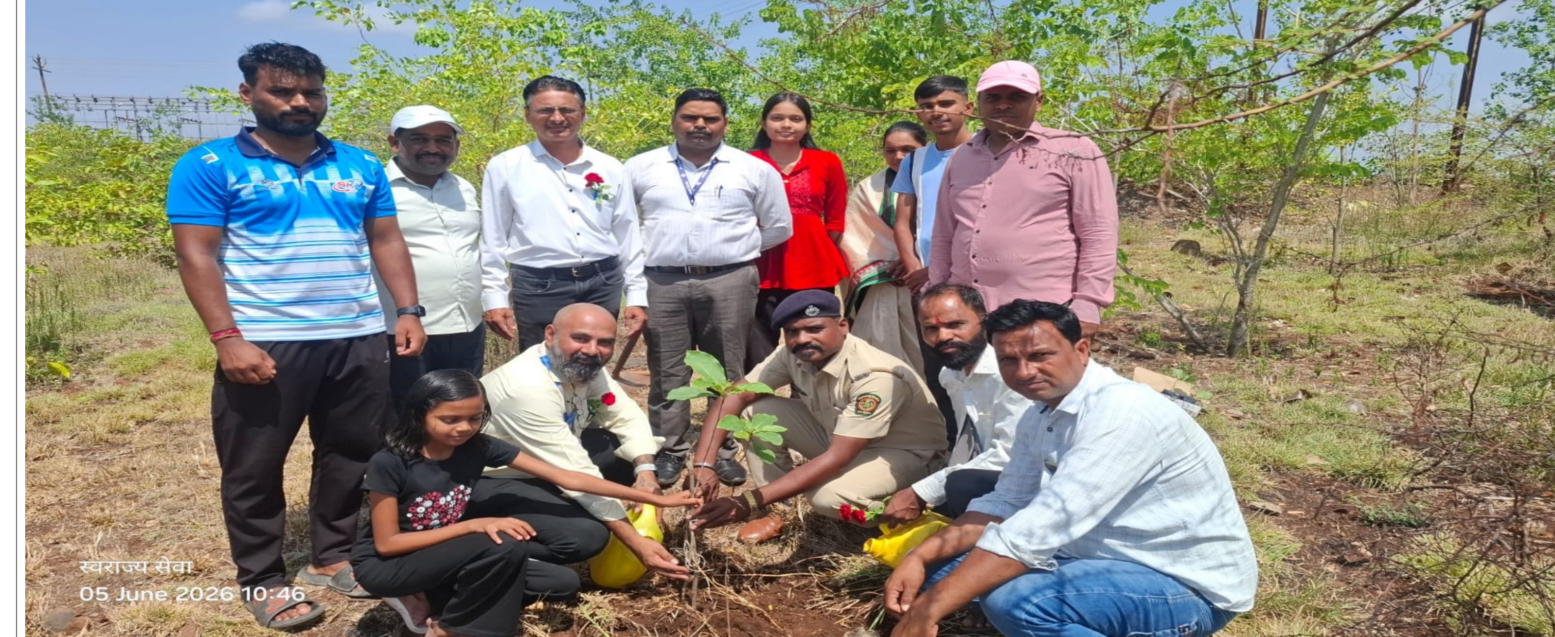
जागतिक पर्यावरण दिनानिमित्त दुर्मिळ पिवळा पळस वृक्षाची लागवड