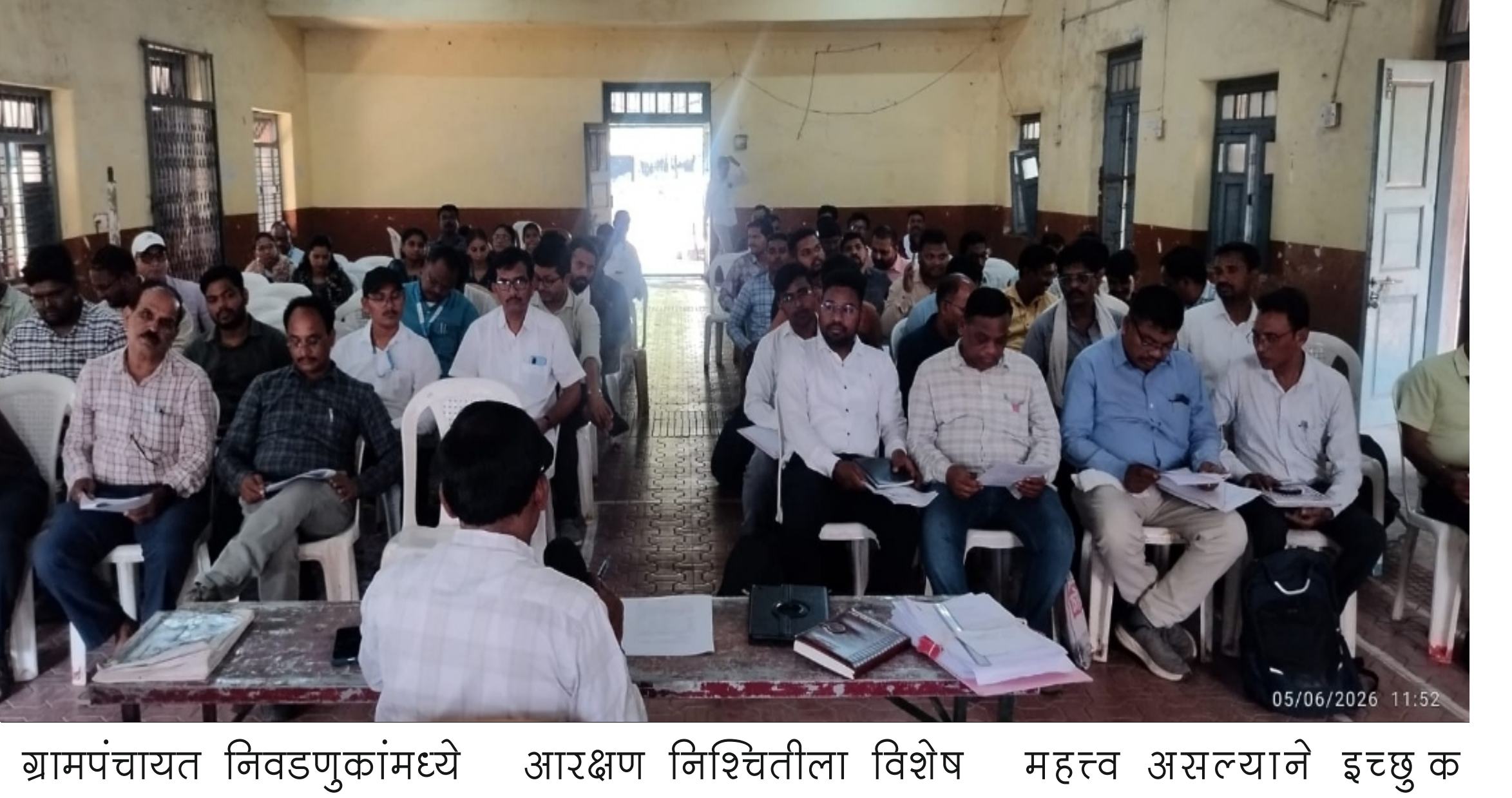
ग्रामपंचायत निवडणुकांमध्ये आरक्षण निश्चितीला विशेष महत्त्व असल्याने इच्छुक

महिलांसाठी सदस्य पदांचे आरक्षण निश्चित करण्यात येईल. संपूर्ण प्रक्रिया प्राधिकृत अधिकार्यांच्या उपस्थितीत पारदर्शक पद्धतीने राबविण्यात येणार असल्याची माहिती प्रशासनाने दिली आहे. अंशतः अनुसूचित क्षेत्रातील बोरगाव, कारेगाव राम, पहापळ, चनाखा, ढोकी, कोंघारा, चालबर्डी आणि पिंपरीबोरी या ग्रामपंचायतींसह बिगर अनुसूचित क्षेत्रातील २३ ग्रामपंचायतींचा या आरक्षण सोडत समारंभ आहे.